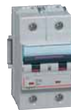
DX³ 25 kA (pág. 148)